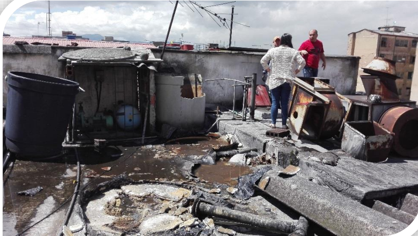
Demolición de tanques en asbesto cemento

Retomamos labores en el edificio Calle 18 # 13-26. Actualmente en mantenimiento correctivo y preventivo de las redes hidrosanitarias, red contraincendios y ventilación; una vez culminada esta actividad procederemos a instalación de cielo raso y pintura general.