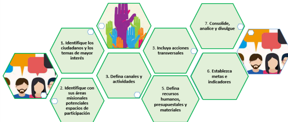
Figure 1: Pasos para la formulación de la estrategia de política de participación ciudadana

En este marco y en cumplimiento a lo dispuesto por los artículos 2, 3, 20, 23 74 y 103 de la Constitución Política-CP- del 1991 y el artículo 2 de la Ley 1757 de 2015, todas las entidades del orden nacional y territorial deben diseñar, mantener y mejorar espacios que garanticen la participación ciudadana en todo el ciclo de la gestión pública (diagnóstico, formulación, implementación, seguimiento y evaluación). Para ello la Escuela incluye en su Plan de Desarrollo Institucional y Planes de Acción, actividades estratégicas que van a adelantar para promover la participación ciudadana.