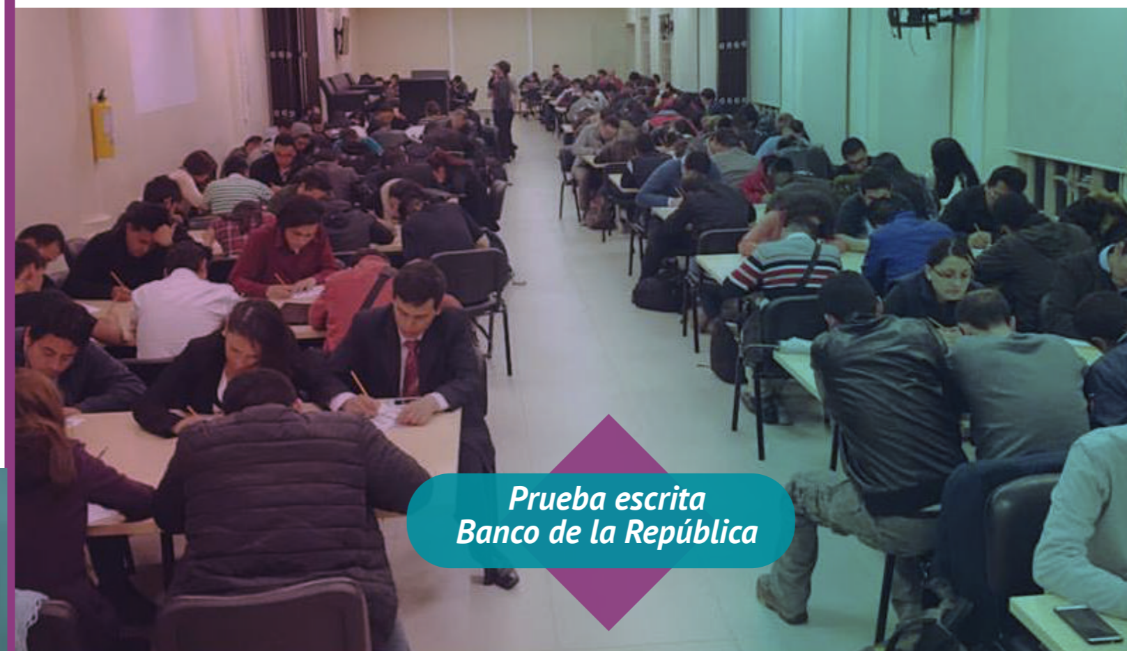
Prueba escrita Banco de la República

En ese mismo espacio, se realizó una primera fase de preselección, en la cual los asistentes aplicaron una prueba con el fin de que esa institución pudiera identificar potenciales candidatos para su vinculación laboral de forma directa en donde los postulantes de la Escuela Tecnológica tendrán exclusividad frente a otras instituciones educativas.